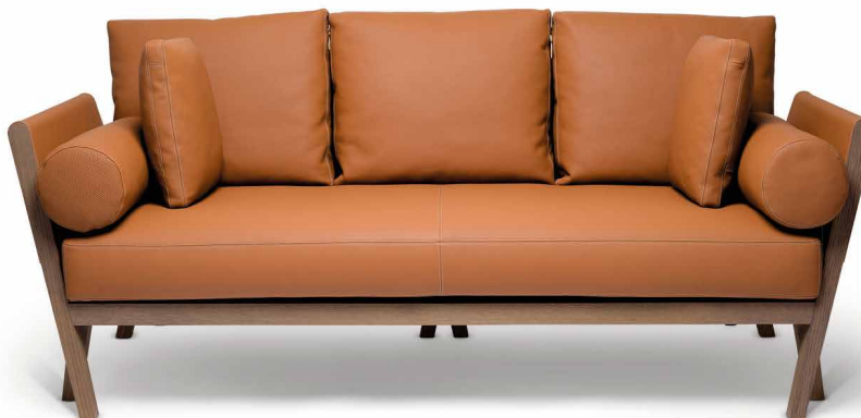
金棕色CLÉMENTINE小牛皮及灰色橡木居家沙發座椅， 愛馬仕, 2022年