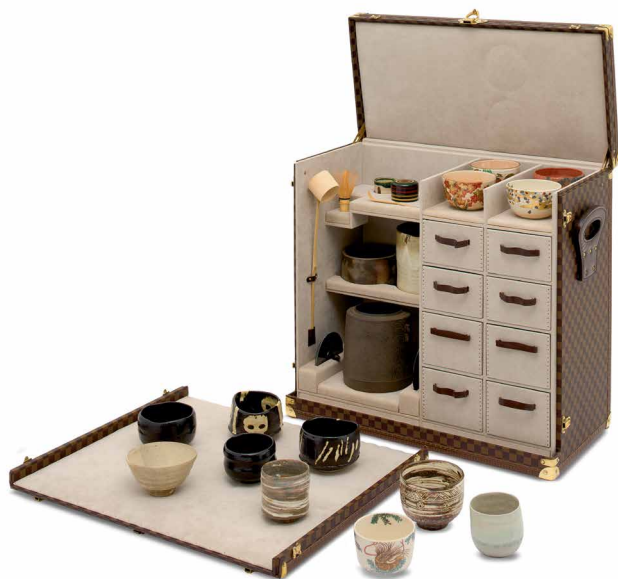
特別訂製DAMIER日式茶道收藏箱 路易威登, 2006