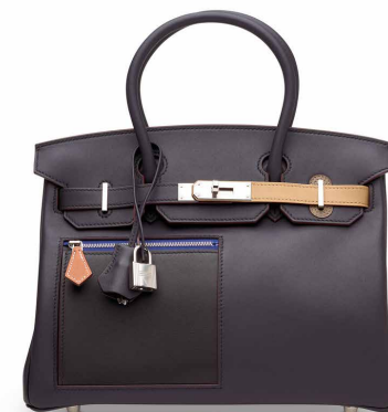
限量版藍色，黑色，奶茶色，大象灰色及金棕色SWIFT 小牛皮30公分COLORMATIC柏金包附鉚金配件， 愛馬仕, 2022年